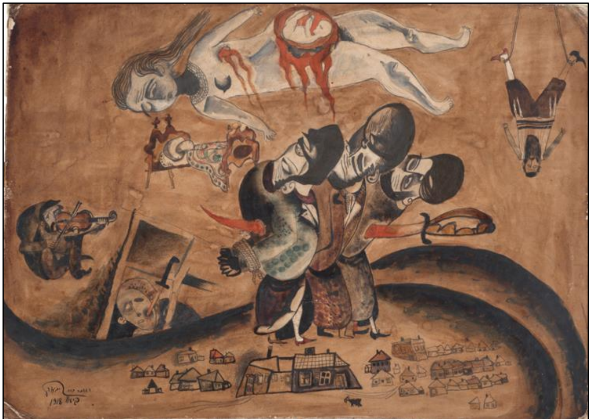
תמונה 7: Issach Issachar Ber Ryback, The Murdered on the Roads , watercolors on paper,

משדיה כרות, בטנה שסועה ועוברה נחשף מתוך הרחם. דמות זו היא עדות להתאכזרות הקשה כלפי נשים יהודיות בפוגרומים. החל מפוגרום קישינב שהתרחש ב-1905 התקבלו דיווחים רבים על עינוי נשים על ידי אונס קולקטיבי, כריתת חזה של נשים צעירות בעודן בחיים ושיסוע בטנן של נשים בהיריון. 55 הדמות הנרצחת ברישום זה מפנה את מבטה לעבר מיטה מעוטרת בצלבים, ובה שוכב ילד או תינוק. הצלבים על המיטה מתייחסים לניסיונות ההגנה העצמית שנקטו התושבים היהודים: הם נהגו להחזיק בצלבים ובאיקונות, בתקווה להסתיר את זהותם היהודית ובכך להינצל מפוגרום. 56