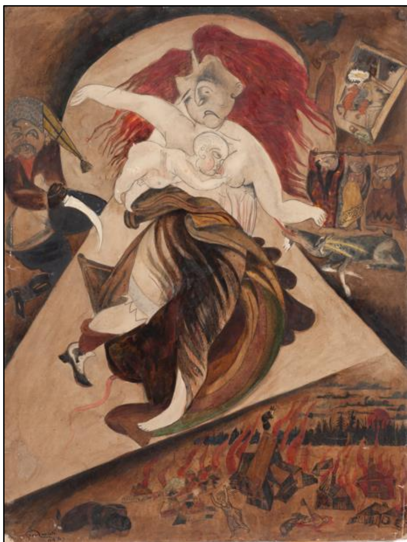
תמונה 6: Issachar Ber Ryback, The Mother and the Child , watercolors on paper, 35x45 cm, 1918, Mishkan Museum of Art Ein Harod

התייחסות נוספת אל תופעת אונס הנשים במהלך הפוגרומים מוצגת ברישום האם והילד (תמונה 6). במרכז היצירה מוצגת אישה מיניקה. שיערה האדמוני פזור כלהבות, והיא מפנה את מבטה לתינוק העירום היונק משדיה. פלג גופה העליון חשוף, בגדיה קרועים ושובל דם ניגר מבין רגליה. האם אינה מחזיקה את תינוקה, אלא ידיה פרושות לצדדים. מכך ניתן להסיק כי היא כבר אינה בין החיים. מצידה השמאלי של האם מתואר קוזק עם מכנסיים מופשלים, ובידו סכין המכוונת לכיוון האישה והתינוק. מלבד תיאור האונס האכזרי, דמויותיהם של האם והתינוק ברישום זה מייצגות שותפות גורל וטראומה קולקטיבית בעקבות מוות אלים של נשים ותינוקות יהודים במהלך הפוגרומים.