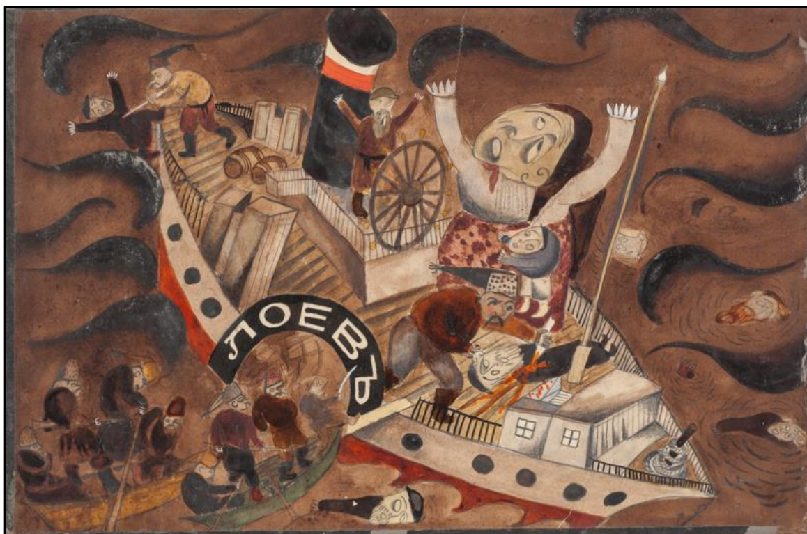
Issachar Ber Ryback, Loyew, watercolors on paper, 35x45 cm, 1918, Mishkan :8 תמונה