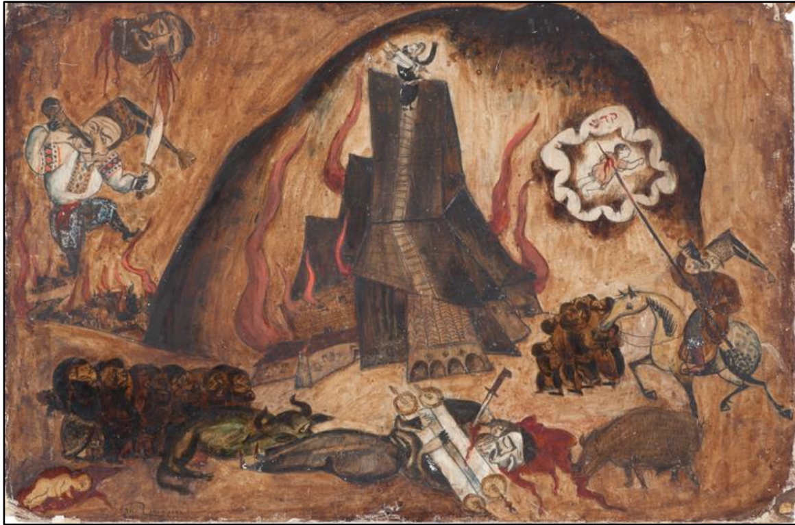
Issachar Ber Ryback, Fall of the Temple , watercolors on paper, 35x45 cm, 1918, תמונה 1: