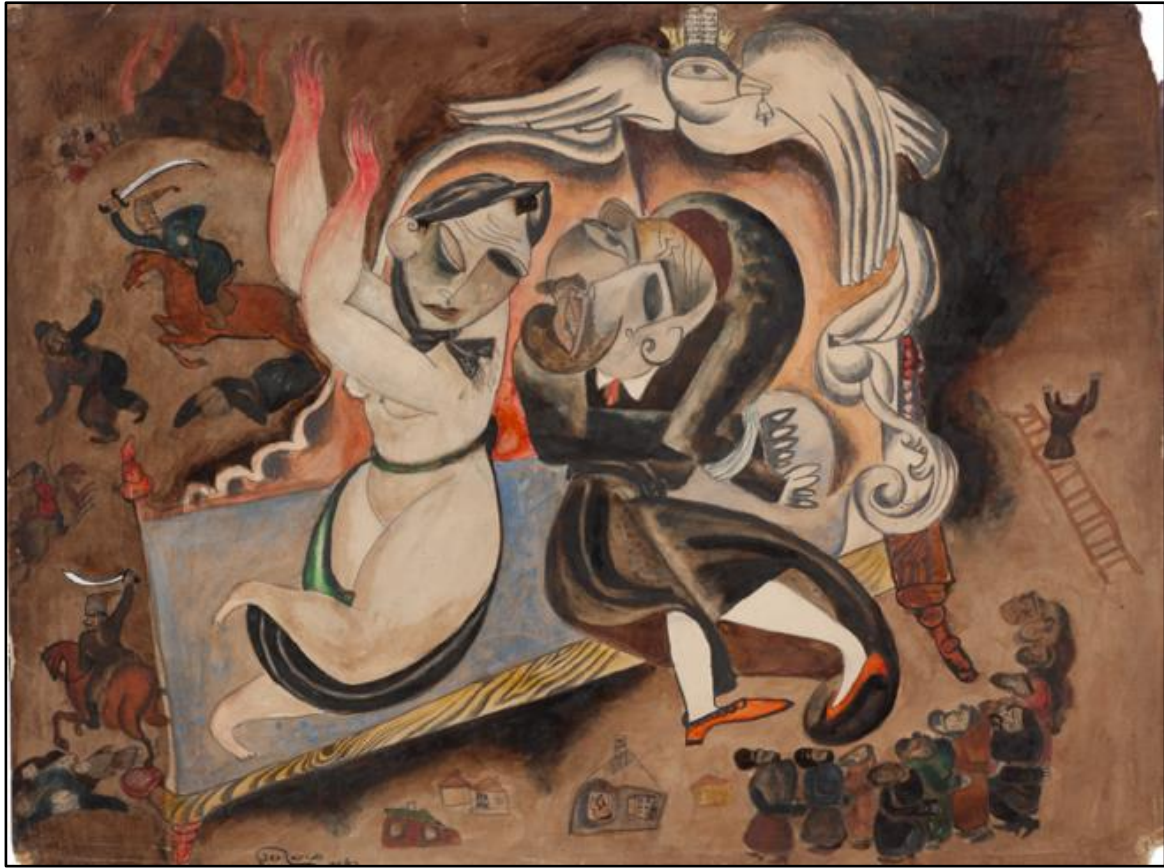
תמונה 5: Issachar Ber Ryback, Under the Wings of the Divine Presence , watercolors on paper, 35x45 cm, 1918, Mishkan Museum of Art Ein Harod

בסדרת היצירות פוגרום בשטעטל התייחס ריבק לתופעה זו, אך הוא נמנע מתיאורים ישירים שלה אלא בחר בתיאורים מרומזים בלבד. שתי היצירות המובהקות ביותר אשר עוסקות באונס נשים הן היצירות תחת כנפי השכינה (תמונה 5) והאם והילד (The Mother and the Child) (תמונה 6). הרישום תחת כנפי השכינה (תמונה 5) מתאר במרכזו זוג המוטל על מיטה. הגבר מוצג בלבוש חסידי מסורתי, פניו נושאות סימני אלימות, ידיו קשורות מאחורי גבו, ומבטו המיוסר פונה אל האישה שלצידו. האישה מוצגת עירומה, בגדיה נקרעו מעליה ובפניה ניכרים סימני אלימות; היא חובשת כיסוי ראש, ומרימה את ידיה האדומות כלהבות למעלה. כיסוי הראש של האישה מעיד כי מדובר בזוג נשוי. הבגדים הקרועים והעירום של האישה מרמזים על אונס אלים, שעה שבעלה הכפות לצידה נאלץ לצפות במעשה. ידיה האדומות של האישה מצביעות על העינויים שעברה.