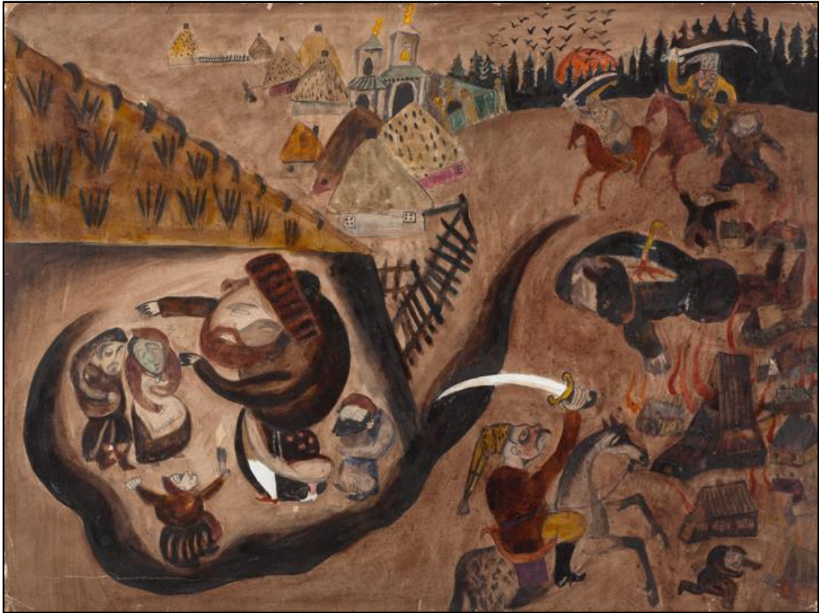
תמונה 9: Issachar Ber Ryback, The Fugitives , watercolors on paper, 35x45 cm, 1918,