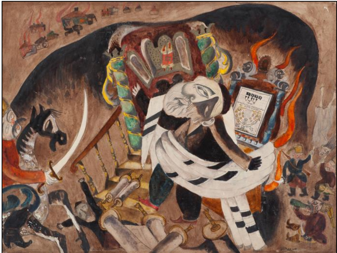
Issachar Ber Ryback, Protecting the Holy Ark , watercolors on paper, 35x45 cm, תמונה 2: 1918, Mishkan Museum of Art Ein Harod

על ארון הקודש, אך נרמס תחת פרסות הסוס של התוקף. דמות זו מהדהדת היסטוריה יהודית מרטירולוגית שהתפתחה מאז ימי הביניים, שבה יהודים נרדפו ונרצחו על עצם היותם יהודים, ומתייחסת לדורות של יהודים שמסרו את נפשם על קידוש השם וקיום המצוות. 42