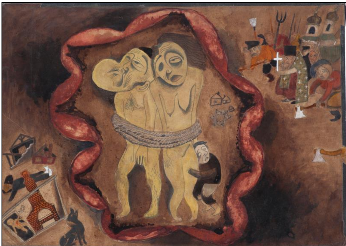
תמונה 3: Issachar Ber Ryback, Honor Your Father and Mother , watercolors on paper, 35x45 cm, 1918, Mishkan Museum of Art Ein Harod

השלב השני של הפוגרום, הכולל השפלות ועינויים, מופיע גם הוא בבירור בסדרת היצירות של ריבק. תיאור מובהק של השפלה מתואר במרכז הרישום כבד את אביך ואת אימך (תמונה 3), המתאר משפחה: גבר ואישה עירומים קשורים בחבל עבה, וילד קטן מחבק את רגלה של האישה. על פי עדויות, חלק משמעותי ממהלך הפוגרומים היה השפלת הקורבנות, רמיסת כבודם ופגיעה בצלם האנוש שלהם. מהלך זה כלל בין השאר פגיעה בכבוד אב ואם, אשר נועד לרמוס את ההיררכיה המשפחתית. פגיעה זו באה לידי ביטוי בהתאכזרות כלפי הקורבנות לעיני בני המשפחה, למשל באמצעות הלקאת הגברים לעיני הנשים והילדים או הפשטה פומבית. 45 ברישום זה הילד נאלץ לראות את הוריו עירומים, חסרי אונים ומושפלים. פני האישה מעוותים וניכרים בהם סימני אלימות. הילד נאחז באם, אך ספק אם אחד מההורים הינו בין החיים.