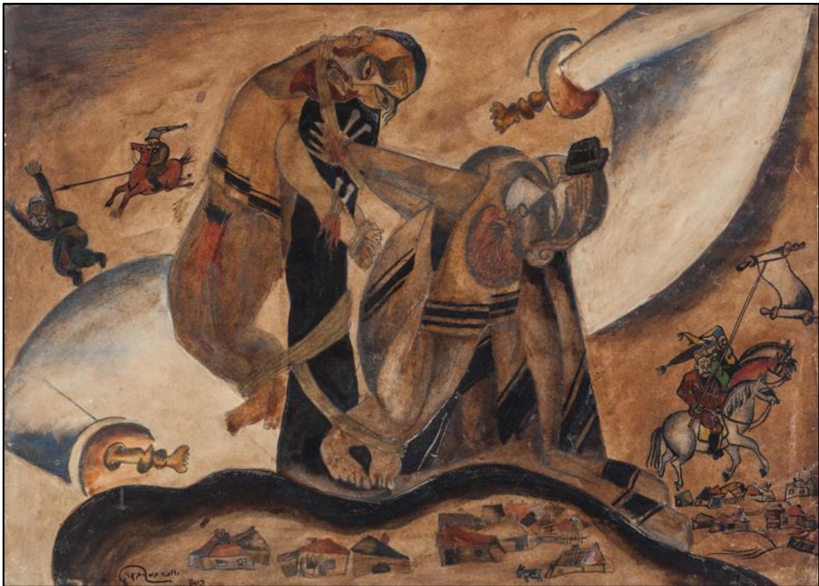
תמונה 4: Issachar Ber Ryback, Not to Slaughter Father and Son in One Day , watercolors on paper, 35x45 cm, 1918, Mishkan Museum of Art Ein Harod

כחלק ממהלך ההשפלה והרמיסה, הקוזקים נהגו להנחיל בקורבנות תחושה קשה של חוסר אונים. 46 ביטוי מובהק לתופעה זו ניתן לראות ברישומים חורבן המקדש (תמונה 1) ו תחת כנפי השכינה (Under the Wings of the Divine Presence) (תמונה 5), אשר מתארים קבוצות של גברים יהודים, ידיהם קשורות מאחורי גבם, נאלצים להסתכל על הפוגרום המתרחש אך אינם יכולים לפעול על מנת להגן על הקורבנות או למנוע את המעשה. חלק מרכזי ממהלך הפוגרום היה לזעזע את הקהילה כולה על ידי כפייה לצפות באונס, בהתעללות ובמעשים קשים אחרים, שעה שהצופים מנועים מלסייע לקורבנות. 47 ביטוי נוסף להתאכזרות בקורבנות הפוגרומים ניתן לראות ביצירה לא תשחט אב ובן ביום אחד (Not to Slaughter Father and Son in One Day) (תמונה 4), המתארת שני גברים עירומים למחצה, קשורים וממוסמרים בידיהם לעמוד, חלציו של אחד מהם כרותים, ולגופם רק תשמישי קדושה.