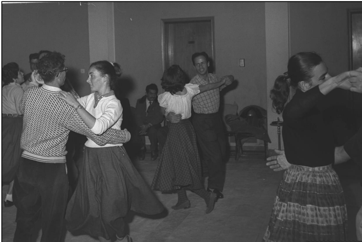
מסיבת ריקודים לנוער, דצמבר 1955.

יחסי מין בראשונה היה לחוויה חדשה ואפשרות לעבור שינוי שאין חזרה ממנו. ומתברר כי אף שהנערות התבקשו כמקודם לציית להוראות, הן היו נכונות לכך פחות מהמצופה מהן, וביתר שאת כאשר הציות למבוגרים התנגש בעוצמה רבה עם צרכיהן האישיים.