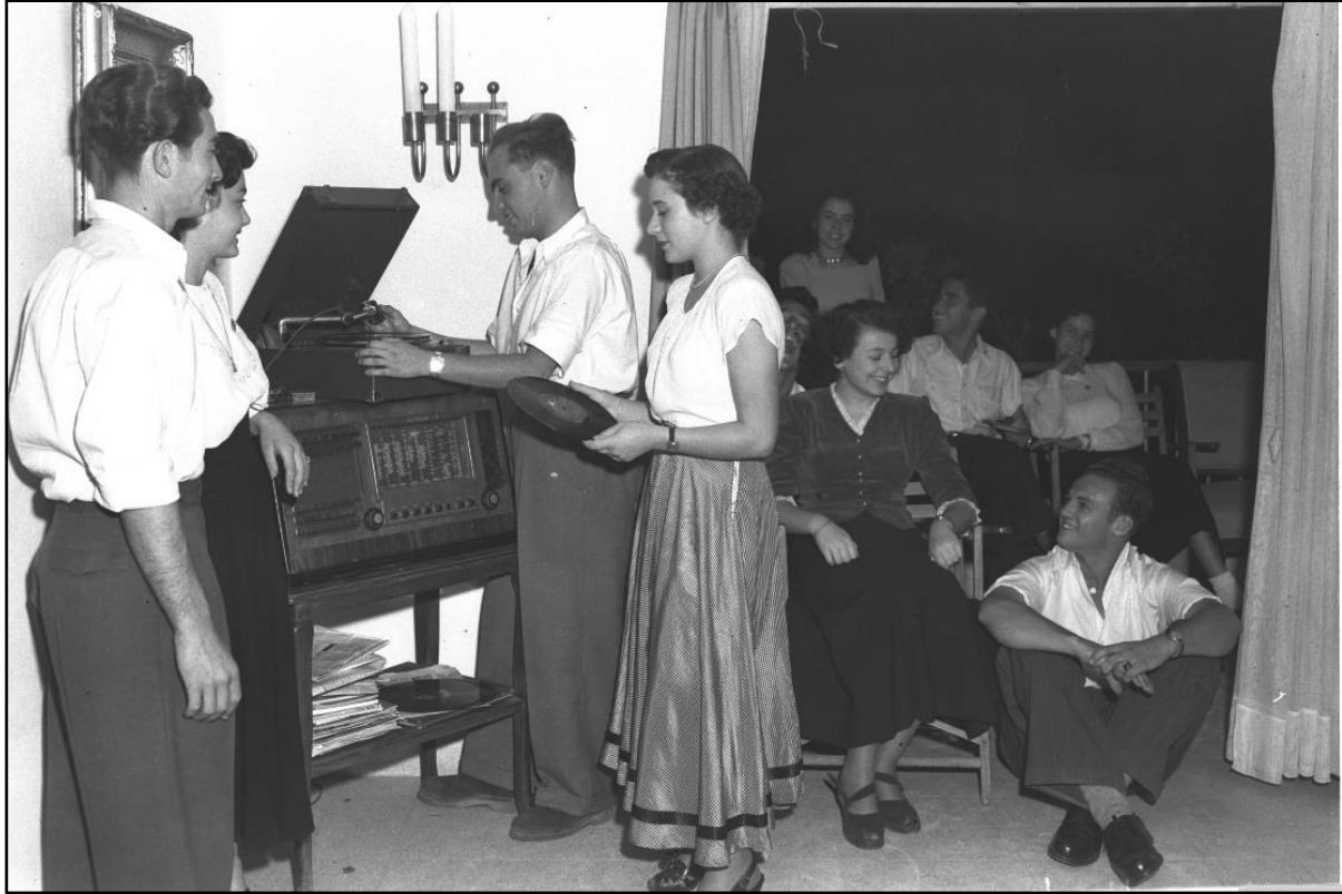
מסיבת בני נוער, ספטמבר 1949.