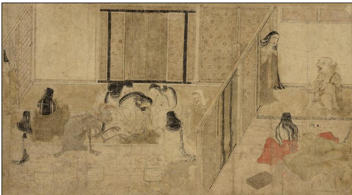
תמונה 4: לידה של בת אצולה מתקופת היאן ו"רוח רעבה" המנסה לתקוף את האם והיילוד, מתוך "מגילת הרוחות הרעבות".

מינמוטו נו מיצ'יסטו (Minamoto no Michisato) למחוז סנוקי (Sanuki) המרוחק, שאליו נשלח כדי לכהן כסגנו של המושל. 43 דוגמה נוספת עלתה במהלך המרידה של טאירה-נו-טדטסונה (Taira no Tadatsune) בצפון-מזרח יפן בשנת 1031, אז בוצע טקס "הנבאי" לטאירה-נו-נאוקטה (Taira no Naokata) לפני שיצא לדכא את המרד. במקרה אחר משנת 1008, מומחי ין יאנג זומנו ללידת יורש העצר של הגבירה שושי (Shōshi), שהייתה אשת הקיסר ובת העוצר פוג'יווארה-נו-מיצ'ינגה (Fujiwara no Michinaga), כחלק ממאמץ לגירוש שדים המסכנים את הלידה. 45 דוגמאות אלה ממחישות כיצד תפיסת הגוף כמרכז הקוסמי של הקיסרות החלה לכלול גם את אצולת החצר, ומומחי ין יאנג החלו לספק שירותי גירוש שדים לטובת ענייני השלטון שבוצעו בידי בני אצולה.