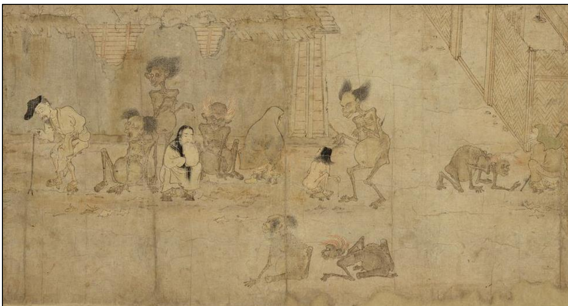
תמונה 3: רוחות רעבות המחפשות קורבנות ברחובות היאן מוכת המגפה, מתוך "מגילת הרוחות הרעבות" המתוארכת לשלהי המאה השתים-עשרה.

החל מהמאה השמינית ולכל אורך תקופת היאן התפרצו מגפות באופן תדיר, והן פגעו קשות באוכלוסיית הקיסרות. 27 למשל, חוקרים מעריכים כי מגפה שהתפרצה בשנת 793 הביאה לחיסולה של כשליש מאוכלוסיית יפן, לרבות אנשי החצר הקיסרית. 28 באותה תקופה מגפות נתפסו כרוחות רעות שנעו על גבי דרכי הקיסרות, והמיטו חולי ומוות על הקהילות שעמדו בדרכן. 29 על פי החוקר מייקל קומו (Como), התמותה הנרחבת שגרם המשבר האפידמיולוגי הובילה לכך שרבים מהמתים לא זכו לקבורה נאותה, והתפיסה המקומית הייתה כי נשמותיהם הפכו ל"רוחות רעבות" שנעו בדרכים בחיפוש אחר קורבנות שיזינו אותן. 30 מכאן שדרכים, לרבות אלה שהובילו לעיר הבירה, זוהו עם חולי וטומאה.