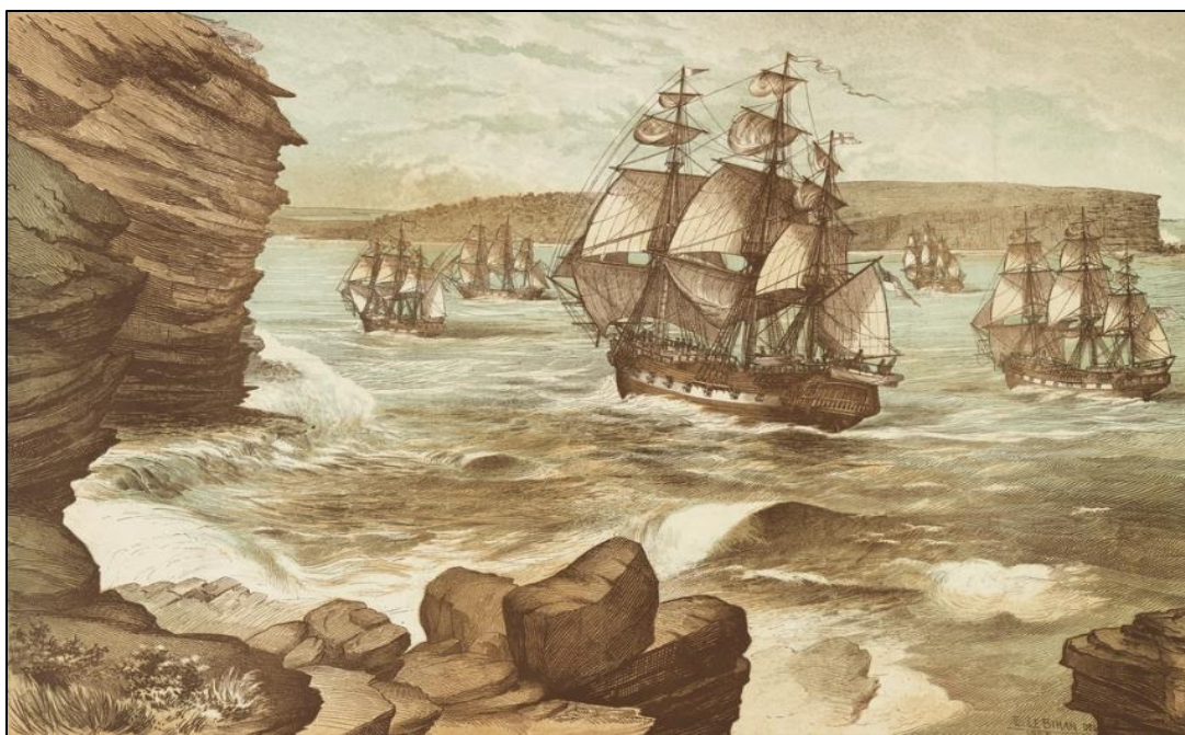
הצי הראשון נכנס למפרץ ג'קסון, מאת אדמונד לה ביהאן, 26 בינואר 1788.

במאות השבע-עשרה והשמונה-עשרה רווחה בבריטניה האמונה כי בחברה המקומית הולך ומתפתח "מעמד פלילי" ("The Criminal Class") מאורגן, אשר מעורר סכנה חברתית ממשית. 4 כדי למגר מעמד זה, הממשל חוקק מערכת חוקים בשם "קוד הדמים" ("Bloody Code"), שקבעה עונש של הוצאה פומבית להורג בתלייה על מאתיים עבירות. 5 למרות זאת, במאה השמונה-עשרה חלה מגמת עלייה בפשיעה עקב תיעוש, אורבניזציה וגידול באוכלוסייה שהובילו לאבטלה, ובהיעדר מערכת אכיפה מסודרת שתעצור את הפשיעה. 6 נוסף על כך, קוד הדמים הפסיק להרתיע בין היתר מכיוון שהנידונים למוות הלכו אל מותם בהתרסה וזכו לתמיכה מהקהל, שהגיב לעונש באלימות הולכת וגוברת. כחלק מתהליך העידון התרבותי בחברה הבריטית, ובגלל הפחד מפני ה"המון" העירוני, הרדיקלי והפוליטי שמועד לפורענות ואלימות, הממשל נדרש לפתרון חלופי – שנמצא בעונש ההגליה למושבות שמעבר לים. 7